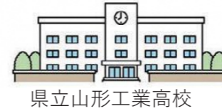
県立山形工業高校